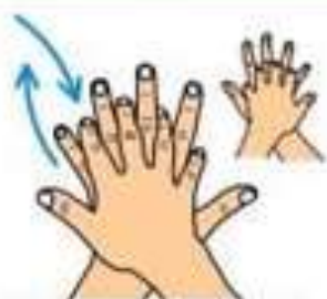
Разотрите мыло правой ладонью поверхность левой руки с перекрещиванием пальцев и наоборот