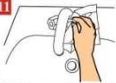
Закройте кран используя одноразовое полотенце