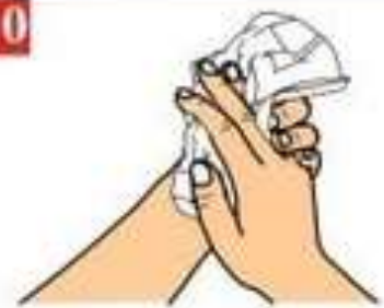
Вытрите руки одноразовым полотенцем