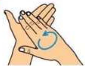
Тщательно разотрите мыло на ладонях