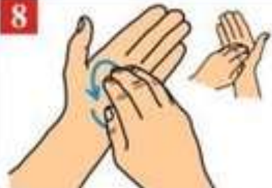
Разотрите ладонь пальцами другой руки в круговом движении