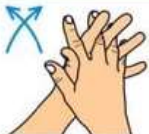
Потрите ладони с перекрещиванием пальцев