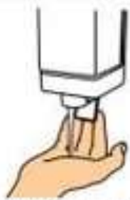
Нанесите мыло на поверхность ладони любой руки