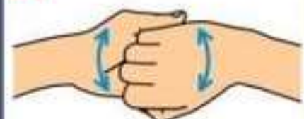
Вымойте кончики пальцев обеих рук загнув их в замок