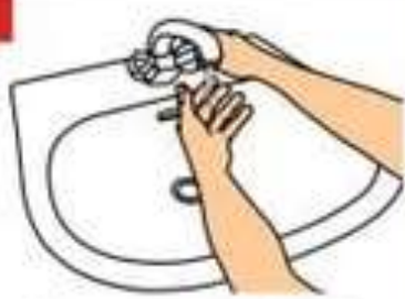
Смойте руки теплой водой