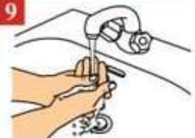
Смойте остатки мыла под струей теплой воды