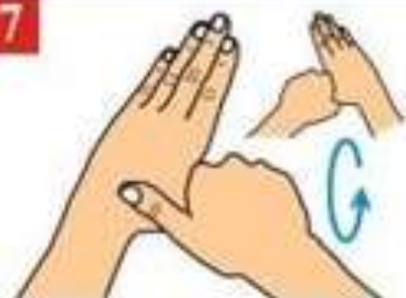
Тщательно вымойте большой палец каждой руки